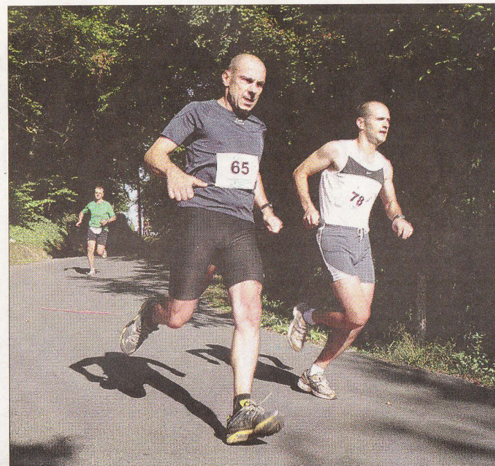
Les coureurs ont bien profité des quelques descentes proposées par le parcours. Car la côte proposée d'entrée leur avait déjà cassé les pattes. Et sur 16 km, il fallait y passer deux fois !

Pour beaucoup d'autres concurrents, l'objectif était simplement de passer la première côte en demeurant le plus frais possible. Et ils étaient nombreux dans ce cas, puisque, avec 217 inscrits et 207 coureurs à l'arrivée sur les deux distances, la Sanilhacoise a battu son record de participation.